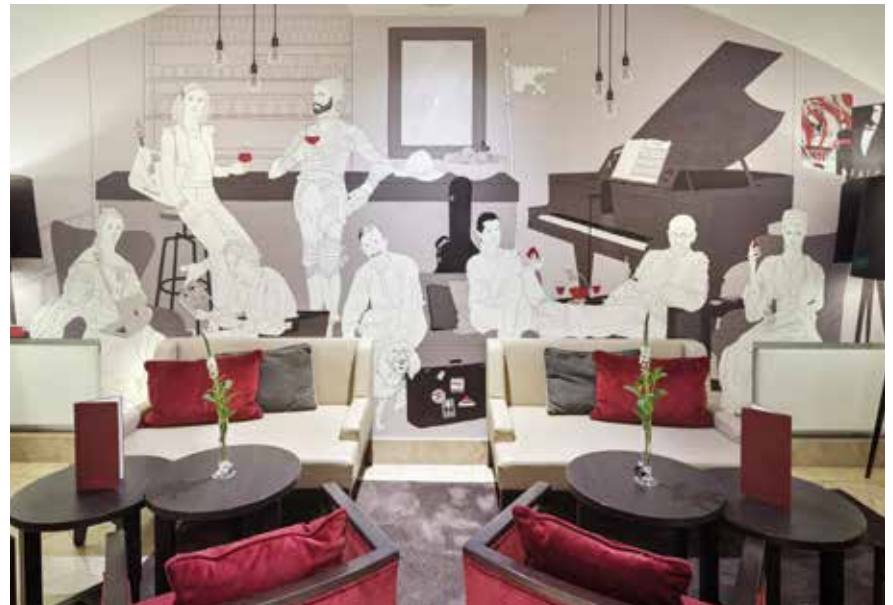
Lernen Sie die Persönlichkeiten des Grätzls kennen.