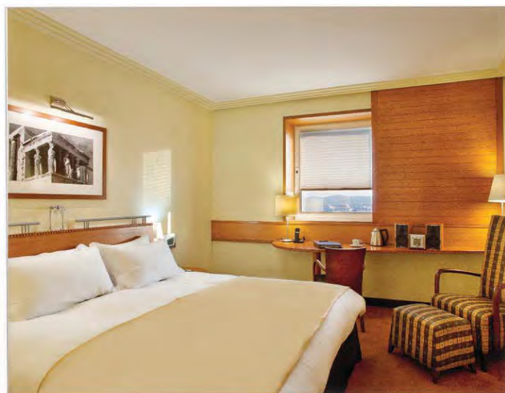
The Executive Room