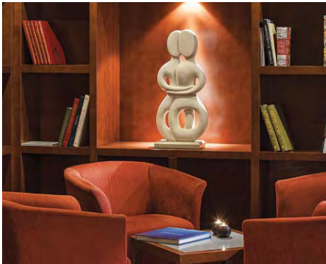
The Artemis Bar