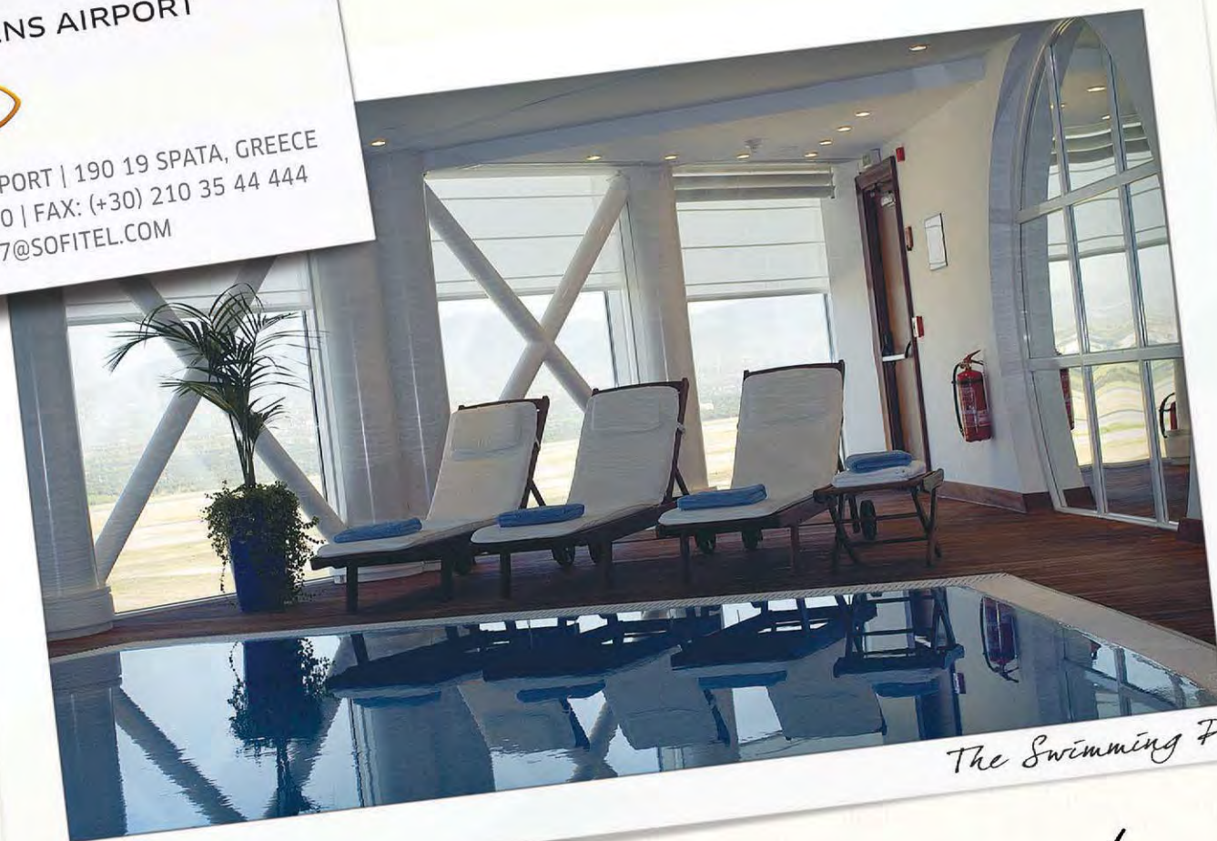
The Swimming Pool