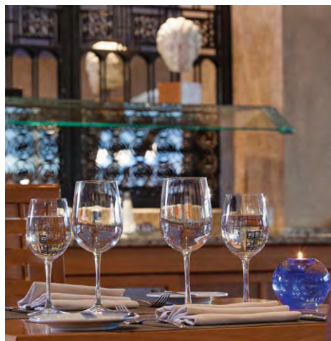
The Mesoghaia Restaurant

Το Μουσείο της Ακρόπολης είναι πόλος έλξης από μόνο του. Επίσης, το Παναθηναϊκό Στάδιο, το μόνο σημαντικό στάδιο στον κόσμο χτισμένο εξολοκλήρου από λευκό μάρμαρο, είναι ανοικτό για το κοινό. Απολαύστε προνομιακή πρόσβαση στο εμπορικό κέντρο Αμαρουσίου, στο Ολυμπιακό Στάδιο και στα πιο σημαντικά αξιοθέατα.