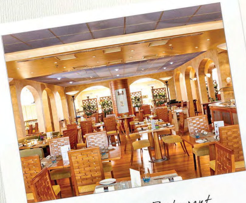
The Mesoghaia Restaurant