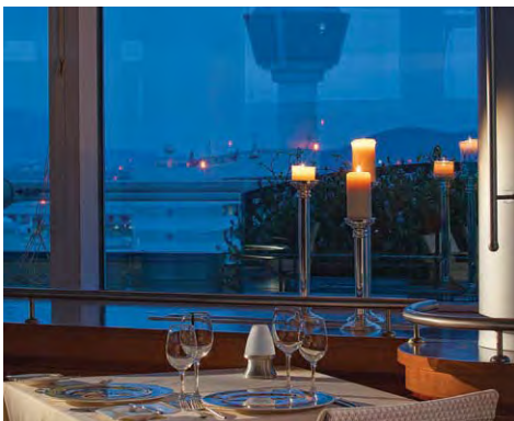
The Karavi Restaurant

offers a breathtaking view over the Athens International Airport and the valley of Messoghia. With its cosy library or its trendy pergola, the "Artemis" bar is the perfect place to share a drink or even enjoy a light snack.